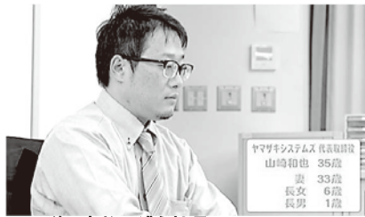
この後 事故に遭う社長