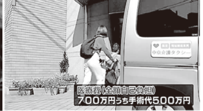
半年後に退院するも第1級障害者に