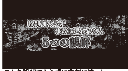
こんな誤解で入らずに悲劇に遭った