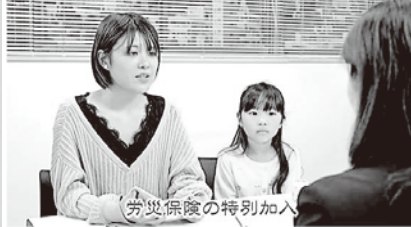
友人の社労士に相談する母娘