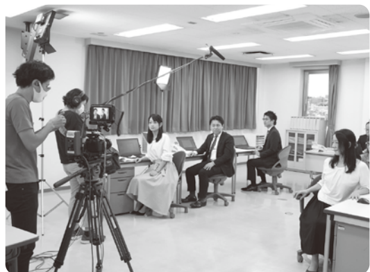
事務所シーンの撮影