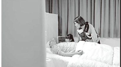
意識不明で病院に搬送。大手術に