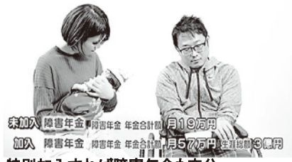
特別加入すれば障害年金も充分