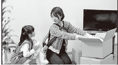
会社は廃業、自宅は売却、妻はパートに