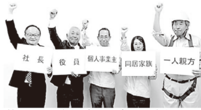
特別加入の有無が私と家族の運命を分ける