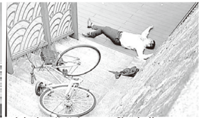
自転車で移動中に河川敷に転落