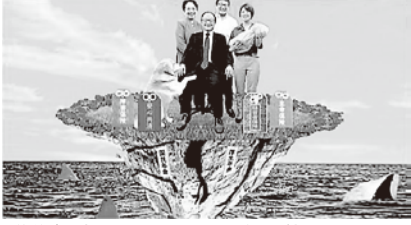
労災保険の未加入はこんな状態