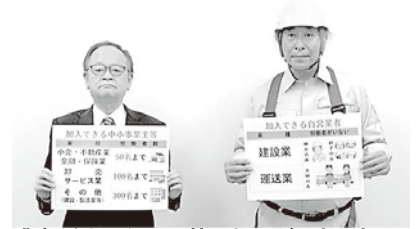
悲劇脱出のための特別加入ができる方