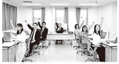
プロローグ 社長も安心、社員も安心