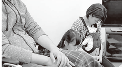
治療費は実費。年金も少なく途方にくれる