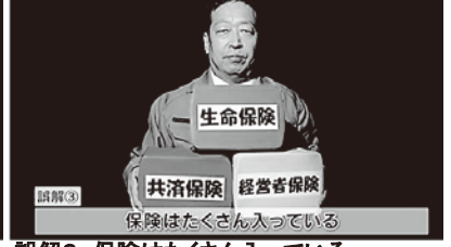
誤解③ 保険はたくさん入っている