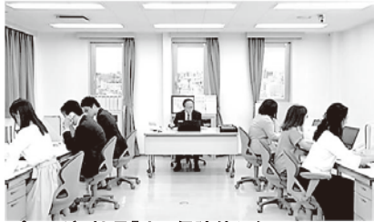
プロローグ 社長「オレ保険使えないの？」