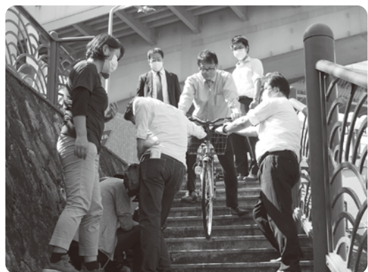
山崎社長が自転車で階段から転落するシーン

当協会は昨年10月、法人企業の社長等、自営業者の皆さんが国の労災保険に加入できる