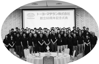
60周年記念式典(社員旅行)