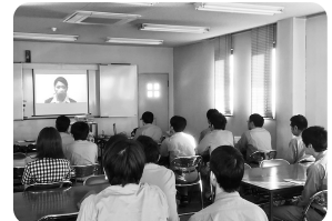
全国労働衛生週間で啓発ビデオ を上映