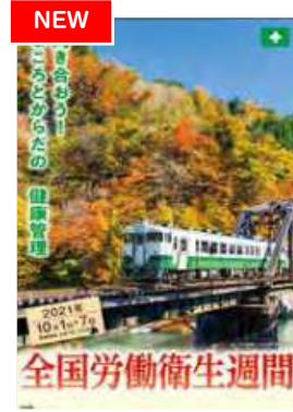
ポスター 風景 B2判(No.343)