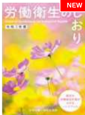
労働衛生のしおり B6判(No.301)

※例年、全国労働衛生週間説明会の会場にて販売しているセットです。 下記用品のセットを通常の販売価格より割安で販売しております。