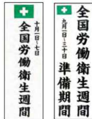
のぼり(大) 1.09×0.38m 準備期間(No.399) 本週間(No.397)