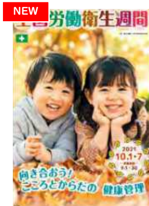
ポスター 子供 B2判(No.345)