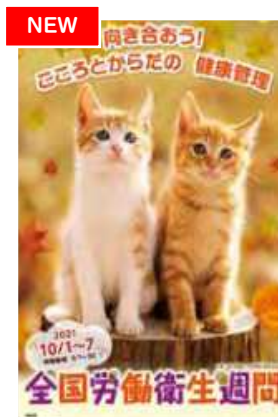
ポスター 動物 B2判(No.344)