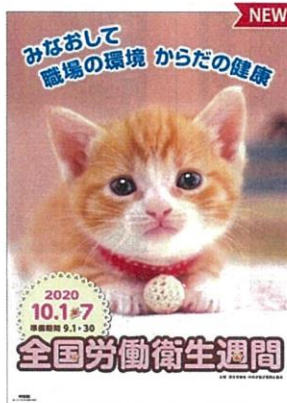
ポスター 小動物 B2版 (No.341)