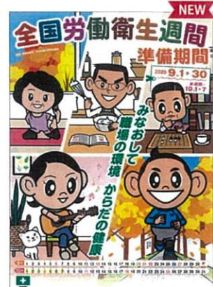
ポスター 準備月間 B2版 (No.343)