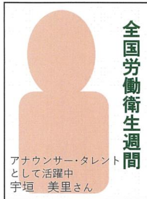
ポスター タレント B2版 (No.338)