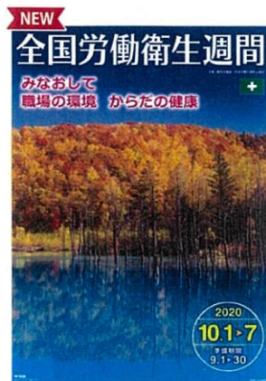
ポスター 風景 B2版 (No.340)