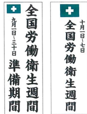
のぼり(大)1.09×0.38m 準備期間 (No.395) 本週間 (No.393) 各1枚