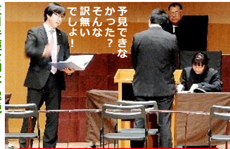
想定外！その理屈、裁判で通じません