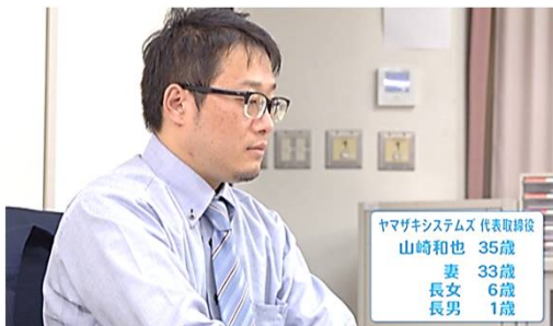
この後 事故に遭う社長