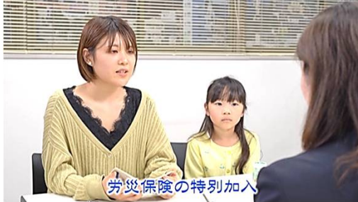
友人の社労士に相談する母娘