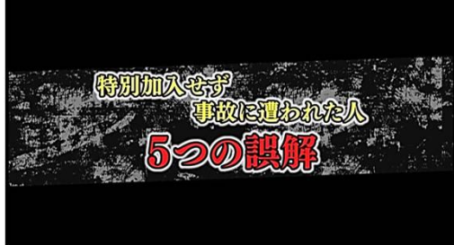
こんな誤解で入らずに悲劇に遭った