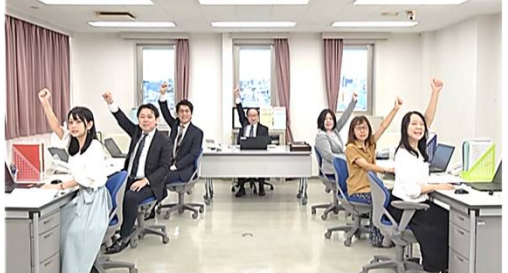
エピソード 社長も安心、社員も安心