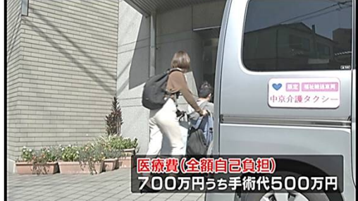
半年後に退院するも第1級障害者に