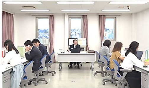
プロローグ 社長「オレ保険使えないの？」