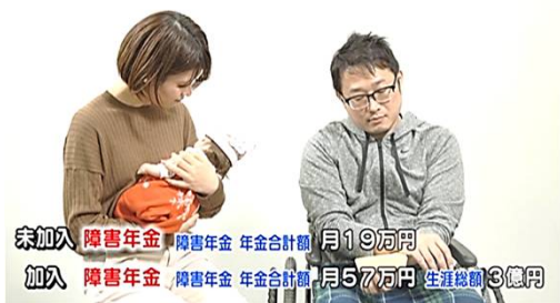
特別加入すれば障害年金も充分