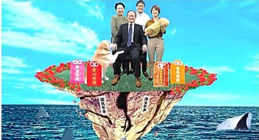
労災保険の未加入はこんな状態