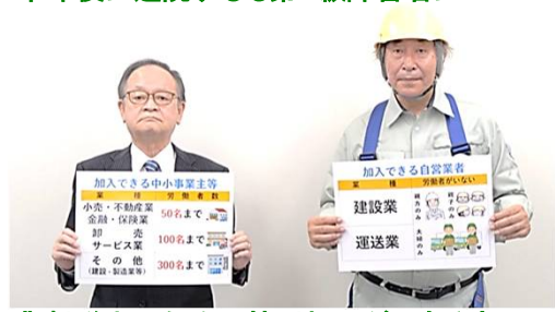
悲劇脱出のための特別加入ができる方