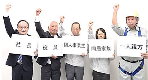
特別加入の有無が私と家族の運命を分ける