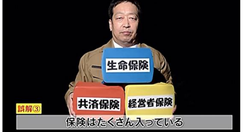
誤解3 保険はたくさん入っている