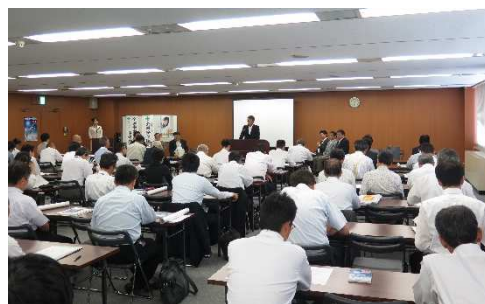
会場の様子 (平成28年度)