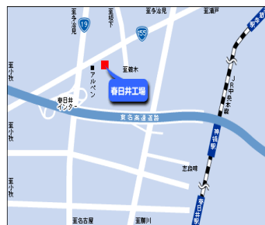
春日井会場 (㈱)ファインセンター春日工場様

(注) 春日井会場は春日井支部役員(㈱)ファインセンター春日工場様のご厚意によりお借りしております。