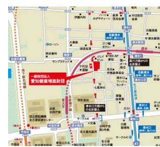
(一財)愛知健康増進財団