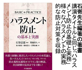
石寄先生編著の著書 講演タイトルと同じ「ハラスメント防止の基礎と実務」の様々な防止対策を収録