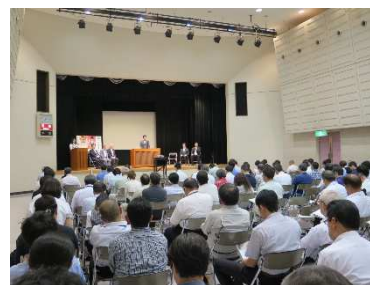
前年度 小牧会場の様子