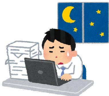
平成30年 名古屋北労働基準監督署管内違反状況

そこで、時間外・休日労働協定等の留意点と過重労働解消のための「適正な時間外・休日労働実施のための説明会」を開催いたします。労務管理担当者等の皆様には、ぜひともご参加いただきますようご案内申し上げます。