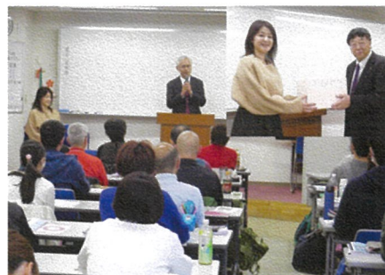
合格者への記念品授与と合格スピーチ