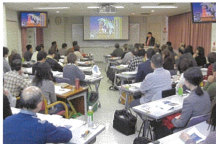
スライドを多用した講義 (受験対策講座・以下同じ)