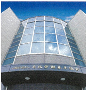
会場の名北労働基準協会