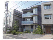
名北協会東隣の、社会保険労務士法人愛知労務管理コンサルティング

労働基準協会関連の社会保険労務士法人より、期間臨時職員または紹介の形で業務を依頼します。