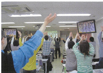
午前・午後2回の体操