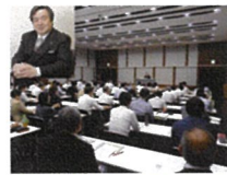
合格者が無料で参加できる 労働界最高権威の 石寄弁護士とのセミナー

労働基準協会合同開催講習等に無料で、会員価格で参加でき、歴代合格者会等での情報交換も可能です。