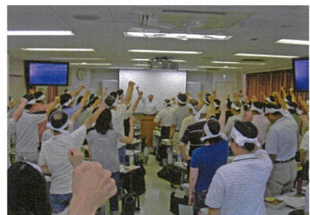
録巻締めて「合格するぞ!」(直前講座)