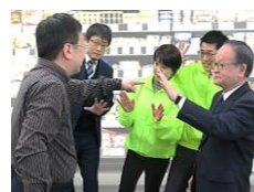
B to C 企業 対 消費者等