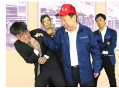
B to B 企業 対 顧客企業