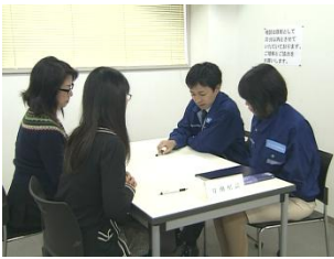
行政への労働者の申告