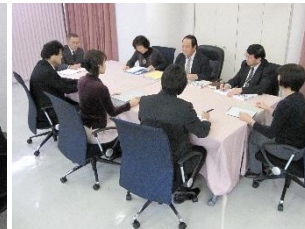
地方裁判所労働審判

都道府県労働局紛争調整委員会のあっせんは、民事上の労使紛争を原則1回2時間で解決します。平成14年度から2.7倍に増加。