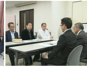
合同労組との団体交渉

民事上の労使紛争を3回の労働審判で解決します。裁判官の呼び出し拒否には過料(金銭罰)が科されます。平成18年から2.8倍に増加