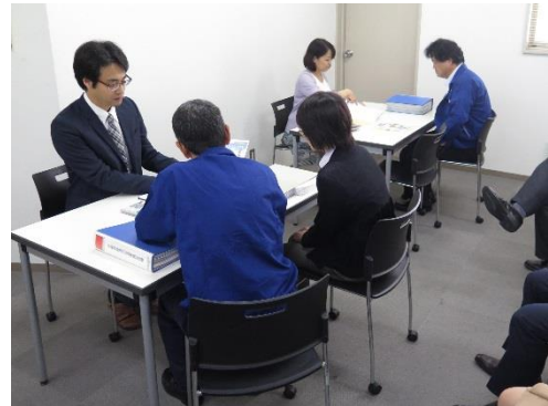
今後各地で相談会を実施します。

お問い合わせ・お申込先 一般社団法人 名北労働基準協会 ホワイト企業推進本部 〒462-8575 名古屋市北区清水1-13-1 電話 (052)961-3655 FAX (052)961-9635