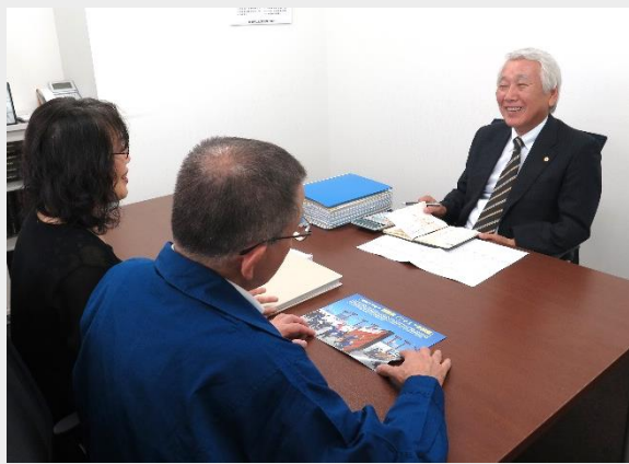
秘密厳守。個室でのご相談となります。

会場： 一般社団法人 名北労働基準協会 名古屋市北区清水1-13-1 ※相談会場には駐車場があります。