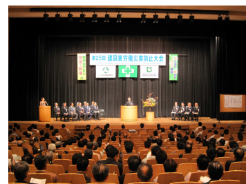
盛況な会場 (昨年度)

● 会場 ウィルあいちホール (愛知県女性総合センター 4階) 名古屋市東区上堅杉町1番地 (052)962-2511