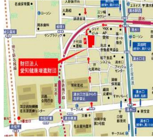
(財)愛知健康増進財団