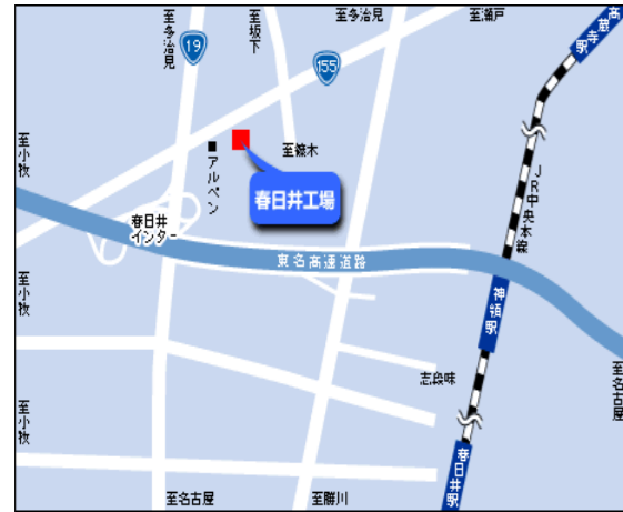
(株)ファインシンター春日井工場様