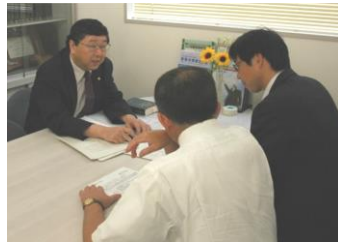
協会相談室でのご来局相談