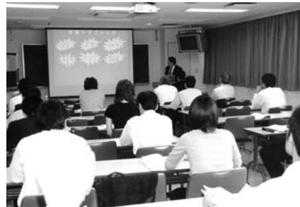
講 義 風 景