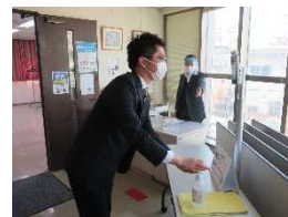
講習会受付時の消毒・検温の様子