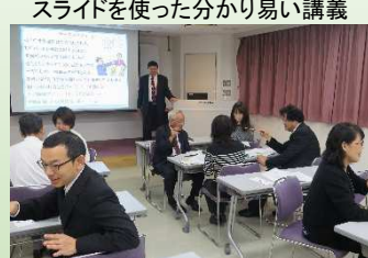
3択問題を考えるグループ討議