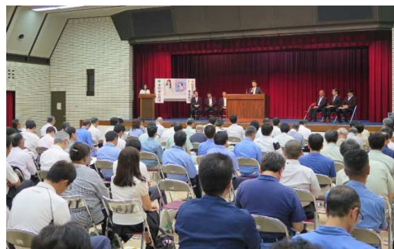
会場の様子(平成29年度小牧会場)