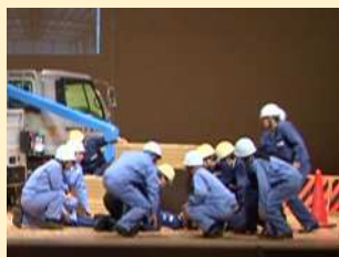
工場出庫口での死亡災害