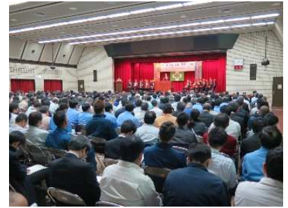
前回大会の会場の様子

そこで、名古屋・尾北地区の各労働基準協会では、全業種に向けた労働災害防止をテーマに「リスクアセスメント」「安全配慮義務」について焦点を当て「名古屋・尾北労働災害防止大会」を開催いたします。ぜひ、多数の皆様にご参加いただきますようお願い申し上げます。