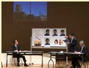
監督署での捜査会議