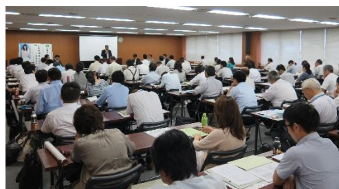
前年度 名古屋会場の様子