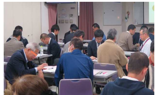
グループ討議の様子