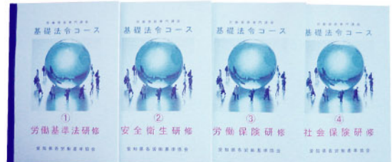
テキスト（基礎法令コース）